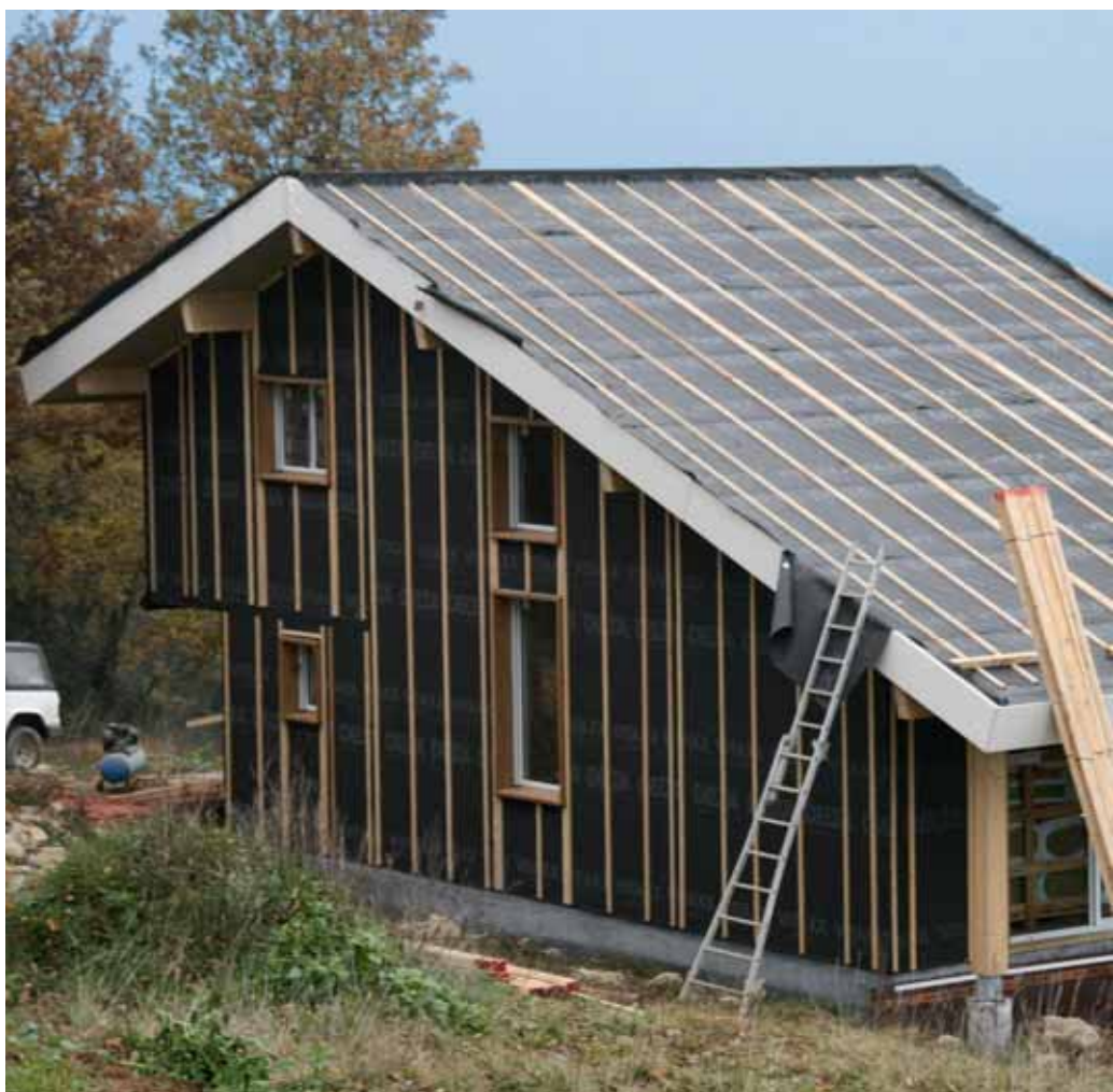
DELTA®-VITAXX zastosowana na dachu i na fasadzie budynku.